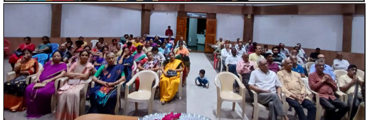
ವಾರದ ಸಭೆಯಲ್ಲಿ ರೋಟರಿ ಸದಸ್ಯರು