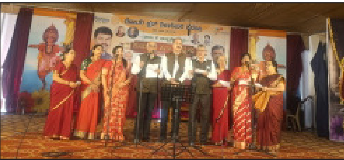
ಗ್ರೂಪ್ ಸಾಂಗ್‌ನಲ್ಲಿ ಭಾಗವಹಿಸಿದ ನಮ್ಮ ಕ್ಲಬ್ ಸದಸ್ಯರು