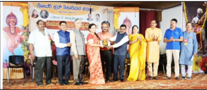
ನಮ್ಮ ಕ್ಲಬ್‌ನಿಂದ ಶಿಕಾರಿಪುರದ ವಲಯ ಮಟ್ಟದ ಕಾರ್ಯಕ್ರಮಕ್ಕೆ 17 ಸದಸ್ಯರು ಭಾಗವಹಿಸಿದ್ದರು.